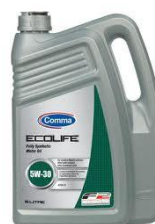
Ecolife 5W-30 Potpuno sintetičko