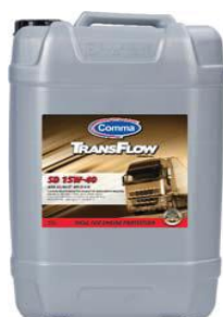
Trans Flow SD Super diesel 15W-40 Unapređeno mineralno