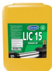
LIC 15 Hidrauličko ulje

Namenjeno za hidrauličke sisteme u bagerima, gredevinskim mašinama i viljuškarima proizvođača JCB, International, Drott, Hyster itd.