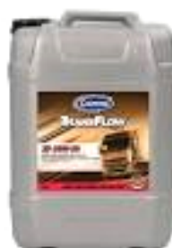
Trans Flow SD Super diesel 20W-50 Unapređeno mineralno