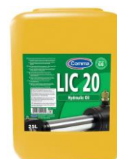
LIC 20 Hidrauličko ulje

Namenjeno za hidrauličke sisteme u bagerima, gredevinskim mašinama i viljuškarima proizvođača JCB, International, Drott, Hyster itd.