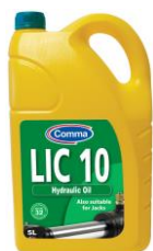
LIC 10 Hidrauličko ulje

Namenjeno za hidrauličke sisteme u bagerima, gredevinskim mašinama i viljuškarima proizvođača JCB, International, Drott, Hyster itd.