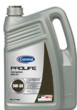
Prolife 5W-30 Potpuno sintetičko